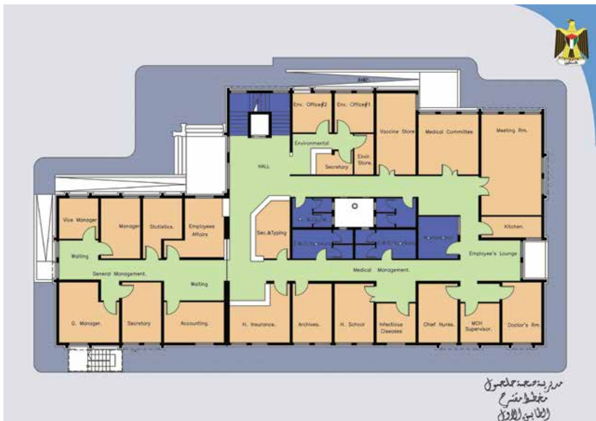
The map of the second floor of North Hebron Directorate in Halhoul

A new Health Directorate providing a range of specialized Primary Care Services will be established in Halhoul, North Hebron.