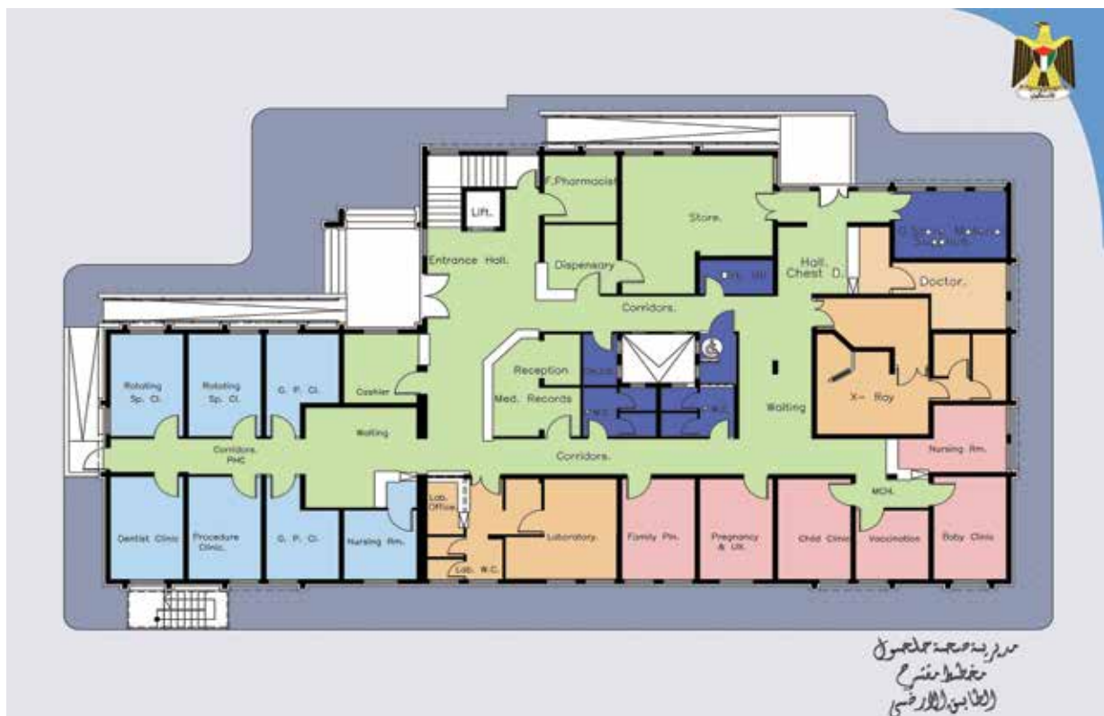
The map of the first floor of North Hebron Directorate in Halhoul