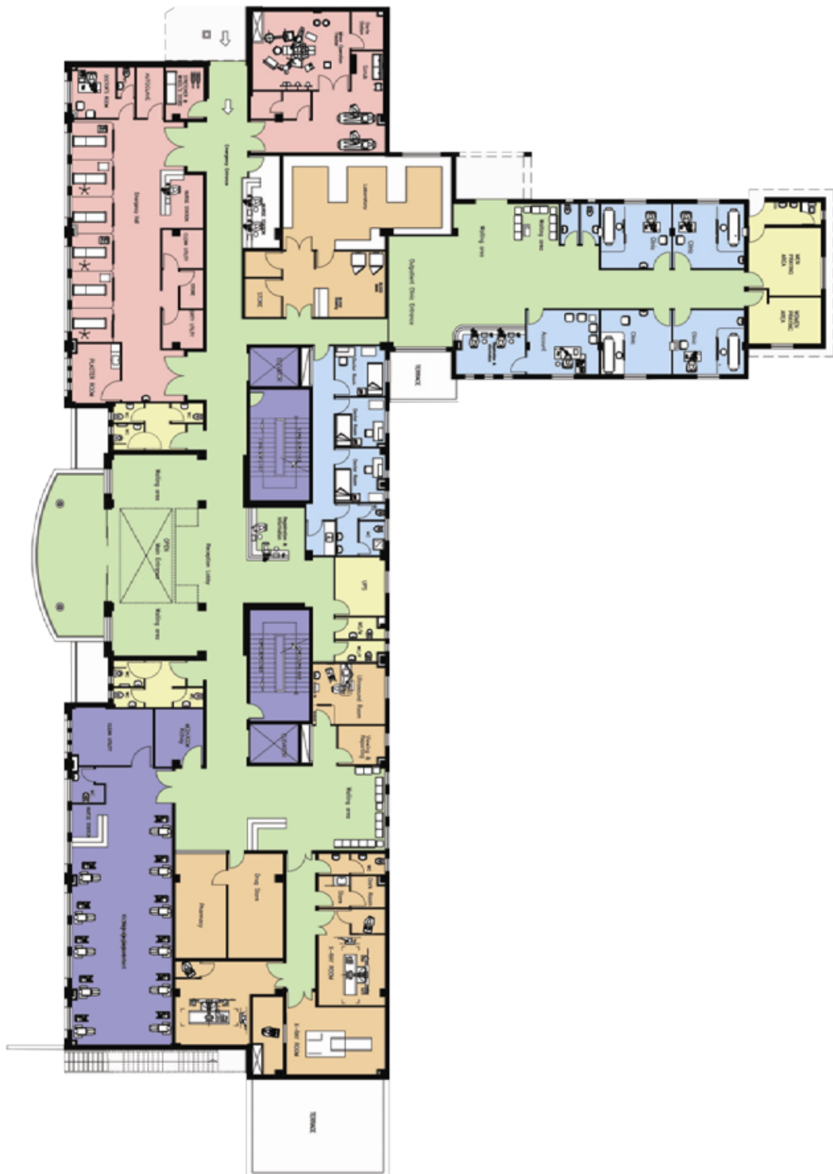
The map of Halhoul and Dura Hospitals